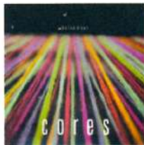
BAIXO E VOZ Cores (independente)

Só Alegria é um prato cheio para inspirar baixistas que querem se aventurar na praia da música instrumental brasileira. Um excelente disco! (Bruno Ladislau)